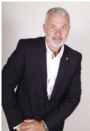
Vážení spoluobčania, obyvatelia našej Lehoty,

každé tri mesiace pre Vás pripravujeme náš obecný časopis, aby sa k Vám dostali informácie, čo nového sa v obci udialo a čo pre Vás pripravujeme na najbližšie obdobie. Upozorňujeme na zákonné povinnosti, ale aj skutočnosti, ktoré sú dôležité pre každodenný život nielen u nás v Lehote.