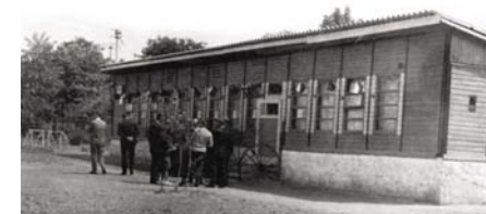
Pôvodná stavba Chaty mládeže z roku 1969-70

Chata mládeže - s výstavbou objektu v časti obce Kapustnice, ktorý mal slúžiť ako Klub mládeže, začala mládežnícka organizácia (STRETA) v roku 1969. Stavebný materiál poskytlo miestne JRD a finančne prispel MNV Lehota.