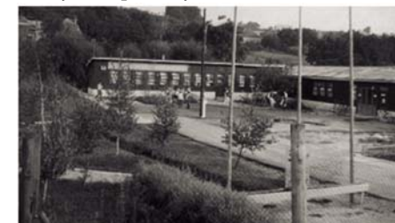
Klub mládeže v Lehotě

Väčšina prác pri výstavbe bola vykonaná svojpomocne lehotskými mládežníkmi a mnohými občanmi obce. Klub mládeže bol slávnostne otvorený 29.11.1969. Už 31.12.1969 v ňom mládežníci zorganizovali prvého „Silvestra“ a v roku 1970 sa v jeho priestoroch uskutočnila 1. ľudová svadba v Lehotě. V ďalších rokoch tu mládežníci zorganizovali množstvo obecných, regionálnych i medzinárodných kultúrnych, spoločenských a športových akcií.