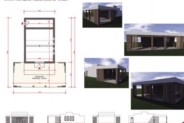
NÁVRH PRÍSTREŠKU PRE DOM SMÚTKU - ŠTÚDIA

Základ jedného stavebného projektu dala nová jednosmerná ulica ku MŠ. Zjednosmernením tejto ulice vznikol priestor pre chodník pre peších. Ten by sa mal realizovať zároveň s položením nového rozvodu vysokého napätia (projekt v prípravnej fáze). Avšak brzdou oboch sú nevysporiadané pozemky pod cestami. Z rovnakého dôvodu stojí aj kanalizácia. Projekt je hotový. Vydaniu stavebného povolenia bránia nevyhsoriadané pozemky (hlavne pod cestným telesom). Všetkým majiteľom takýchto pozemkov už v najbližšej dobe príde výzva na darovanie parciel pod cestami obci.