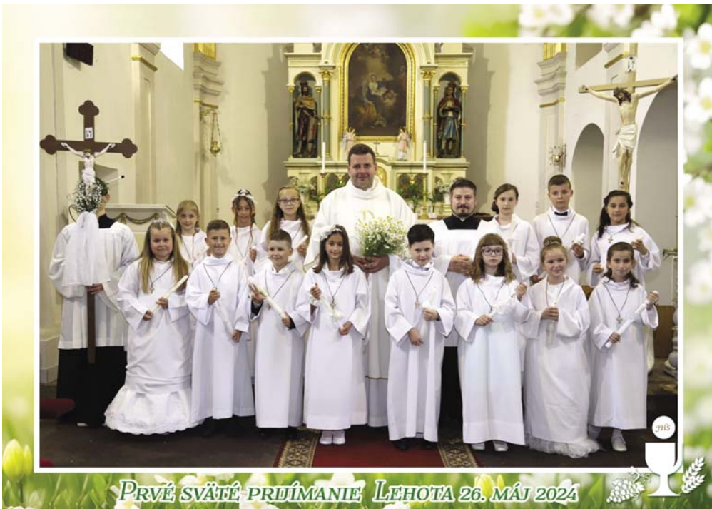
PRVÉ SVÄTÉ PRÍJMANIE LEHOTA 26. MÁJ 2024