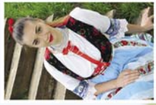
Dominika pami učitelka