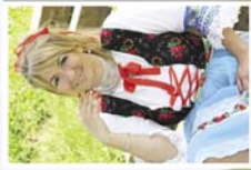
Kátka pami mladitelka