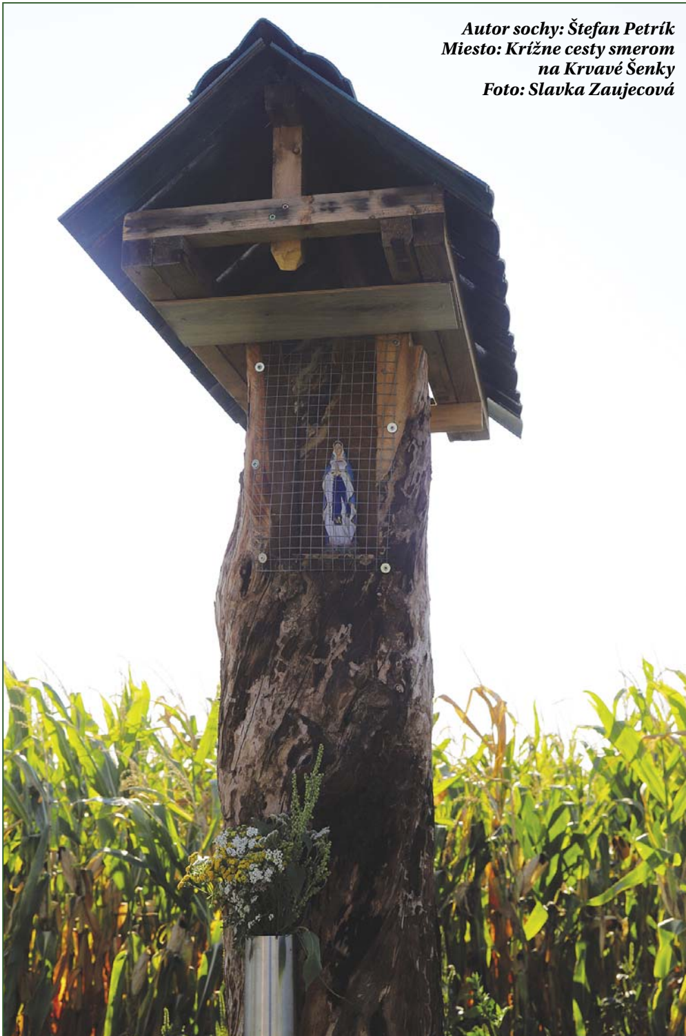
Autor sochy: Štefan Petřík Miesto: Krížne cesty smerom na Krvavé Šenky