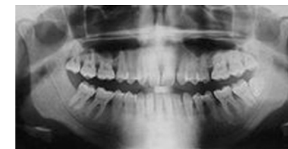
Ortopantomogram čelusti človeka