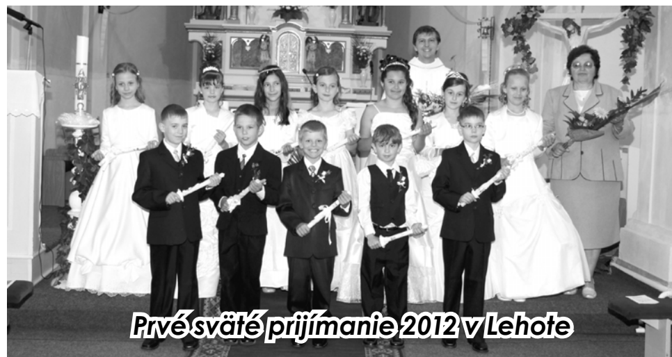
Prvé sväté prijímanie 2012 v Lehote