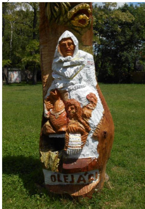
*Lehoťania OLEJÁRI (pri KD)*