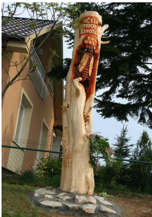
*VČELA symbol života (pri kaplnke)*