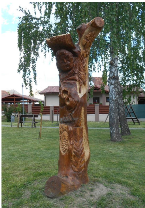
*Svätý JOZEF (pri zdravotnom stredisku)*