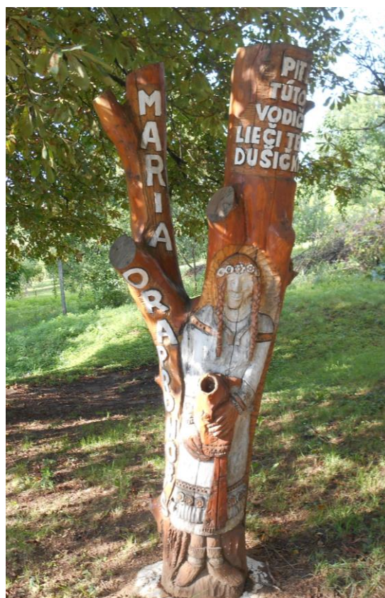
*Dievča so džbánom (pri kaplnke)*