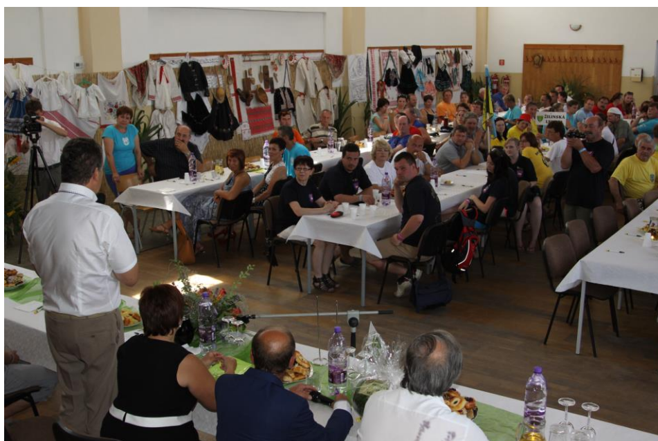
Po sneme sa vytvoril sprievod so všetkými účastníkmi, ktorý začal pri kultúrnom dome a tiahol sa našou dedinou až na futbalové ihrisko.