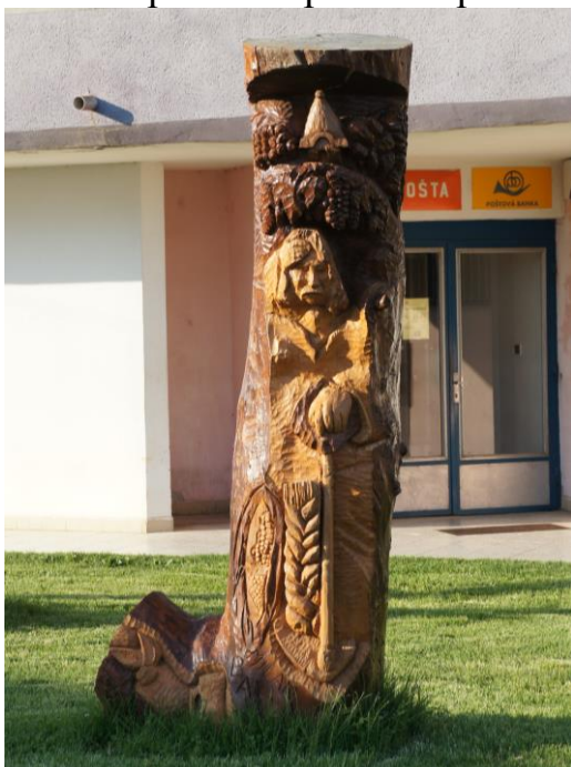
*Lehoťan POĽNOHOSPODÁR (pri pošte)*

Pri práci mu pomáhal pán Milan Balla, st.